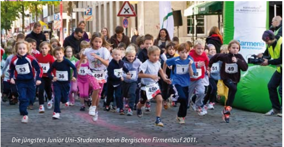
Die jüngsten Junior Uni-Studenten beim Bergischen Firmenlauf 2011.